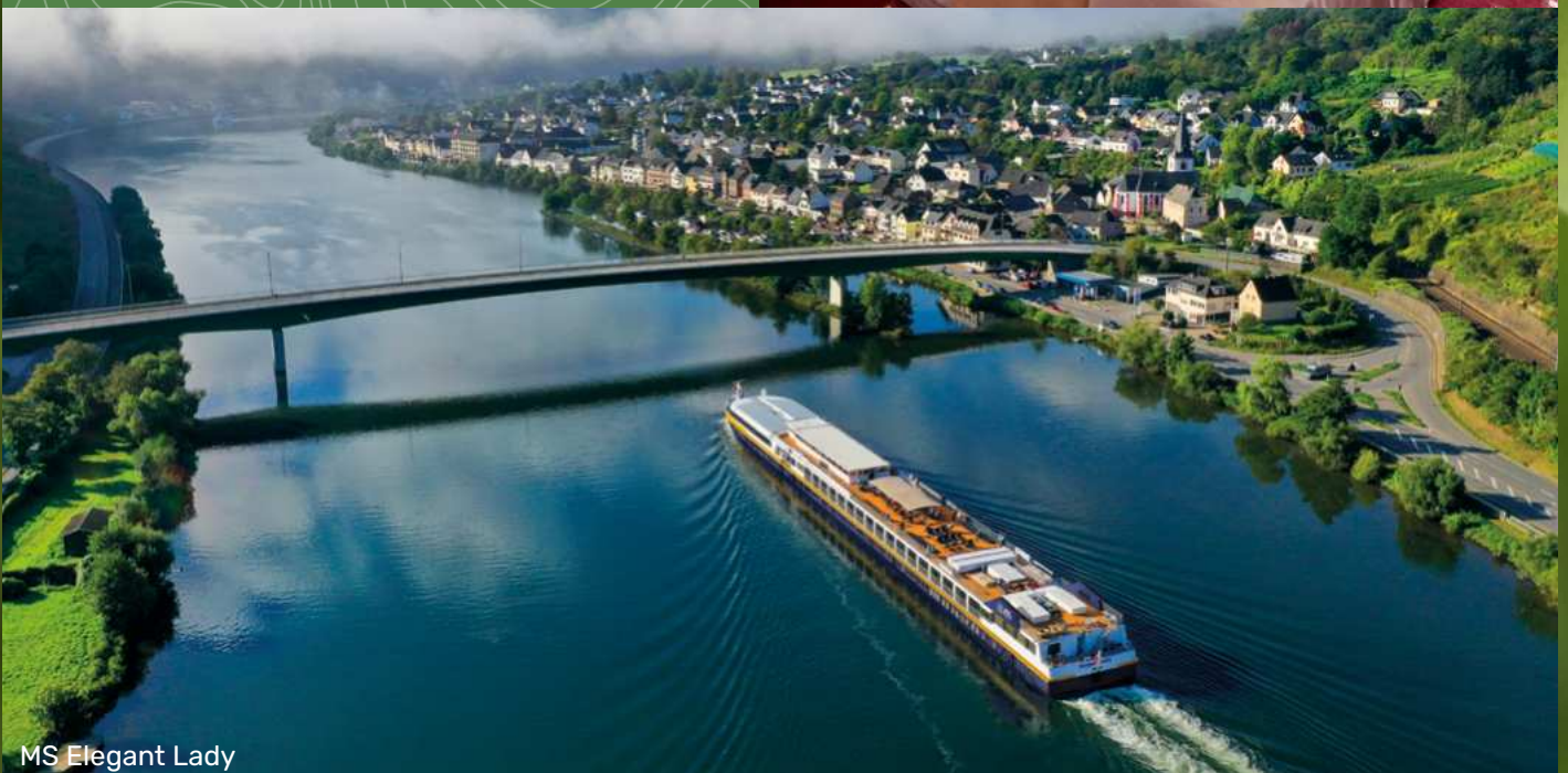
MS Elegant Lady