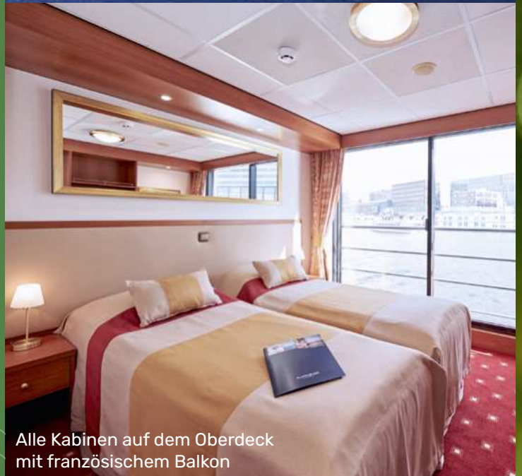
Alle Kabinen auf dem Oberdeck mit französischem Balkon