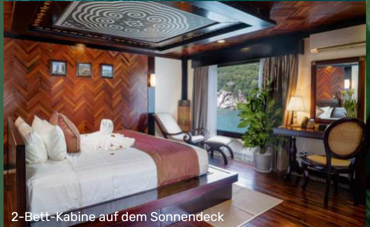
2-Bett-Kabine auf dem Sonnendeck