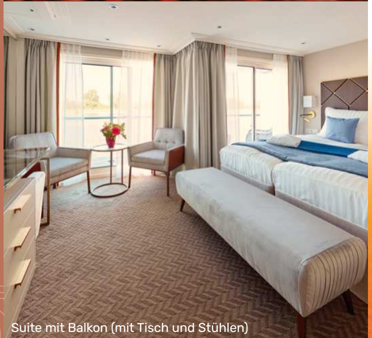
Suite mit Balkon (mit Tisch und Stühlen)