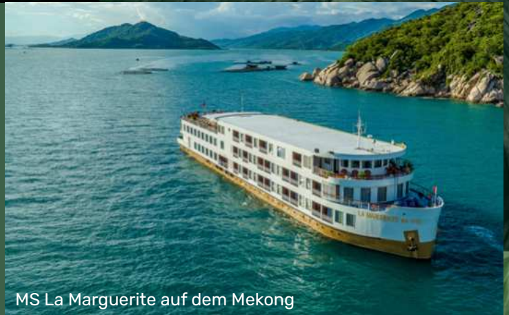
MS La Marguerite auf dem Mekong