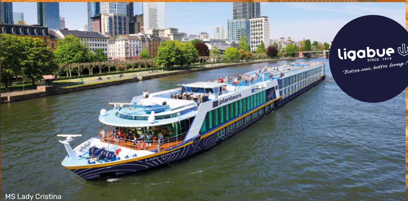
MS Lady Cristina