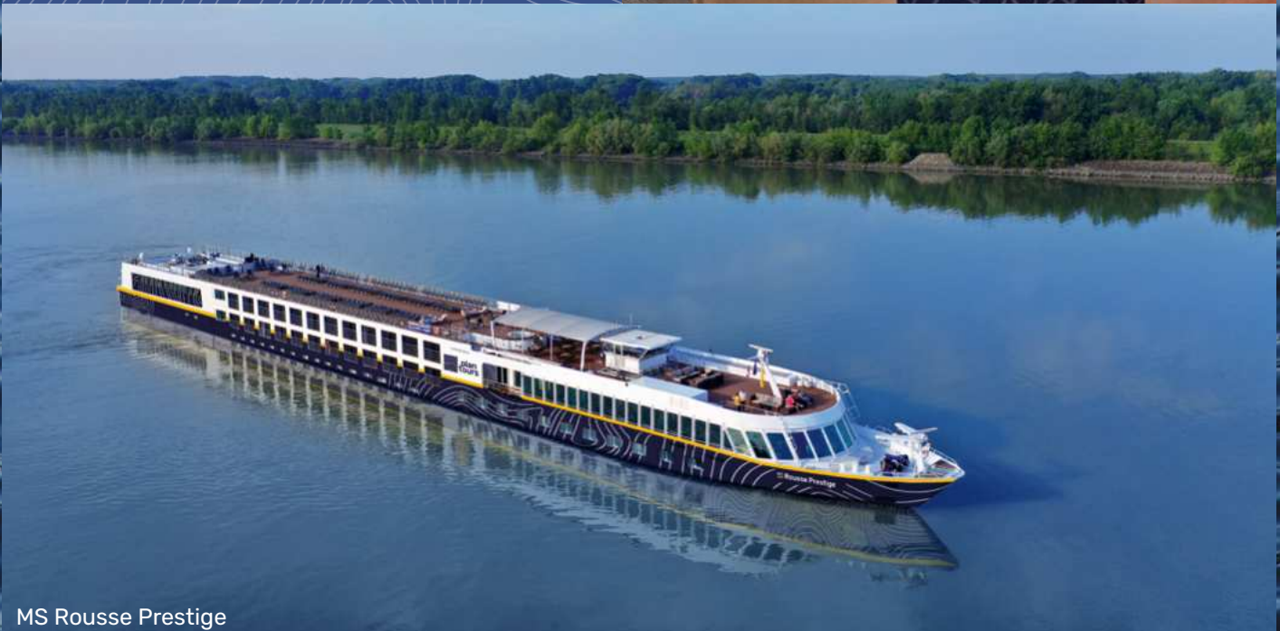
MS Rousse Prestige