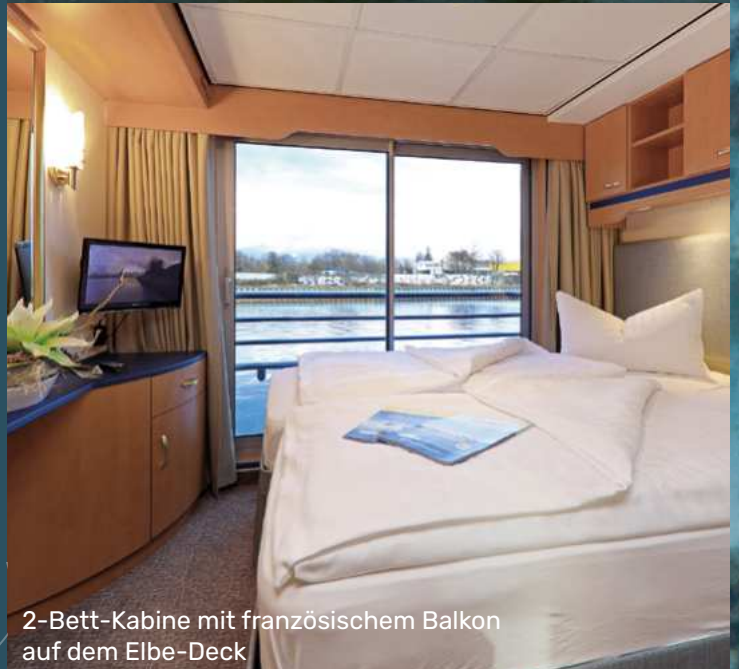
2-Bett-Kabine mit französischem Balkon auf dem Elbe-Deck