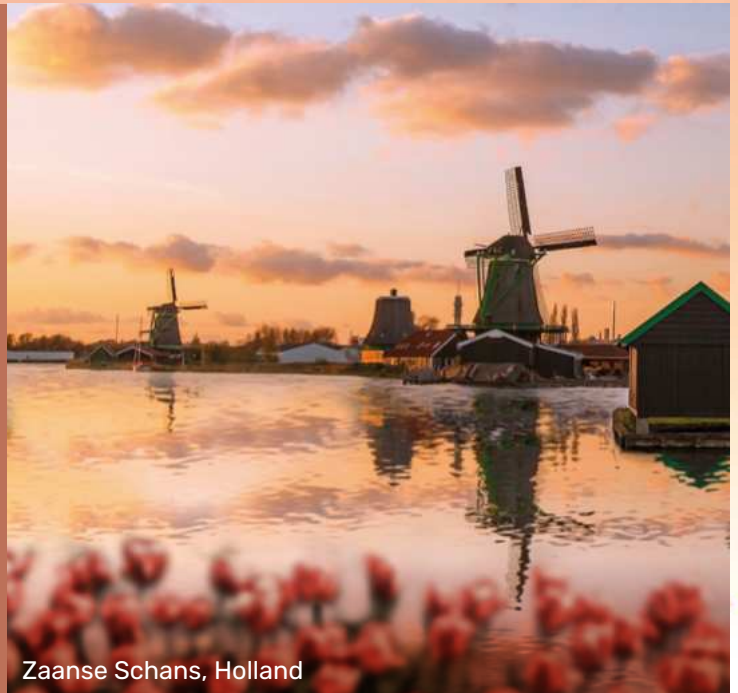
Zaanse Schans, Holland