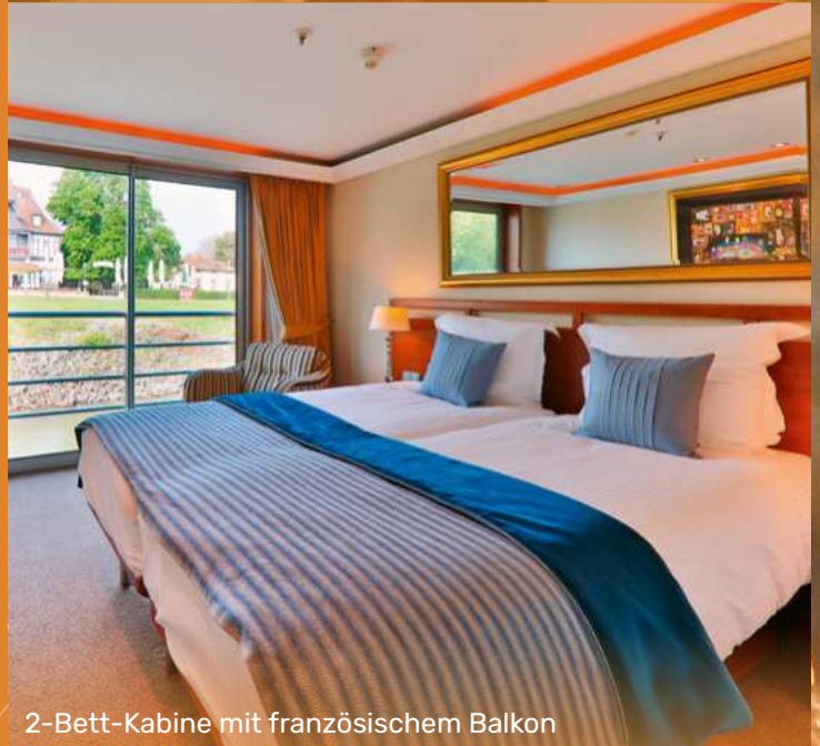
2-Bett-Kabine mit französischem Balkon