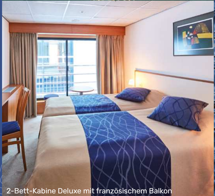
2-Bett-Kabine Deluxe mit französischem Balkon