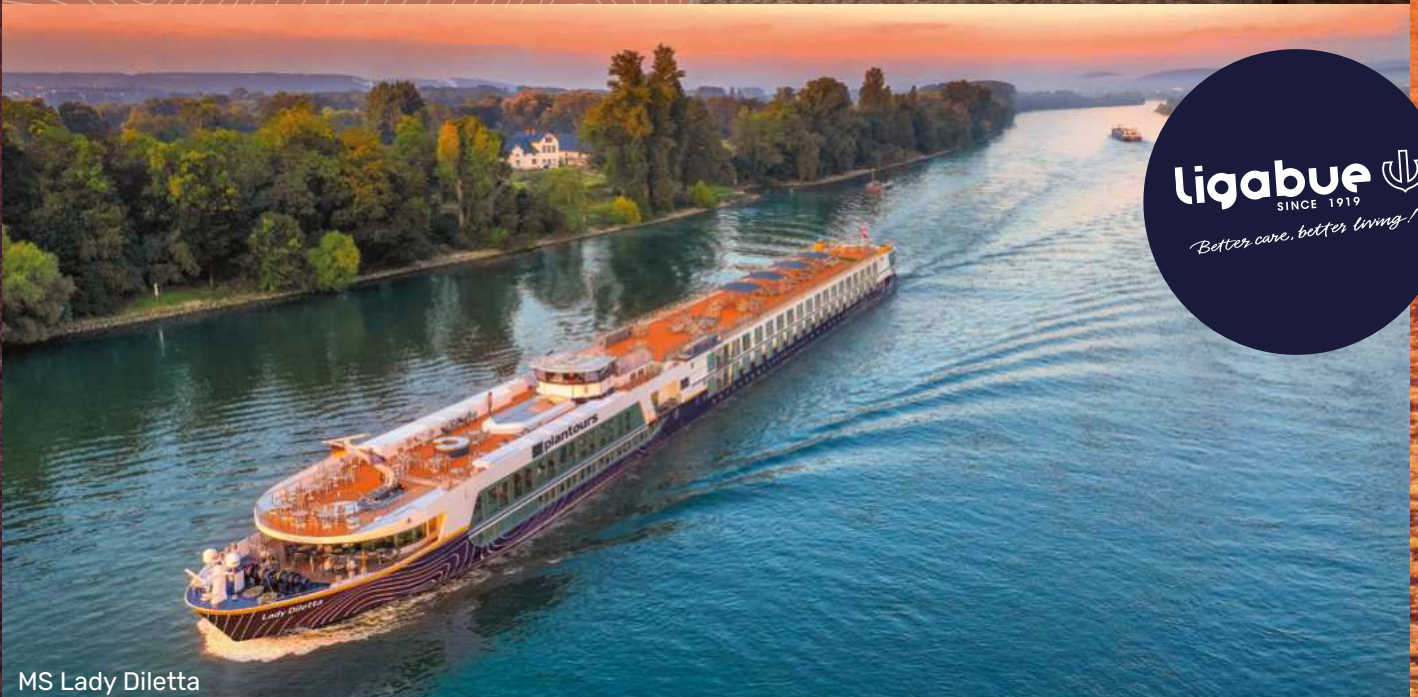
MS Lady Diletta