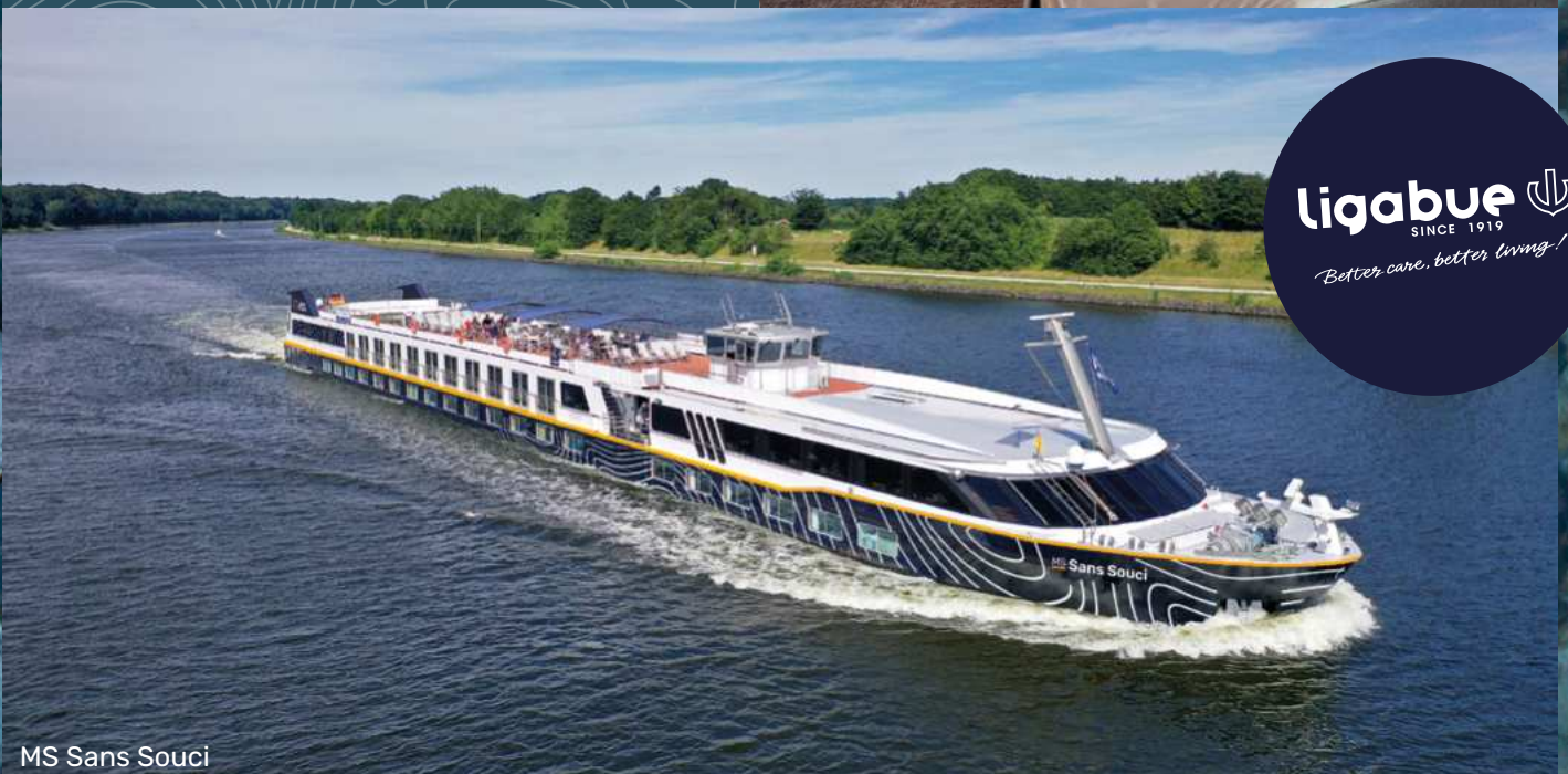
MS Sans Souci